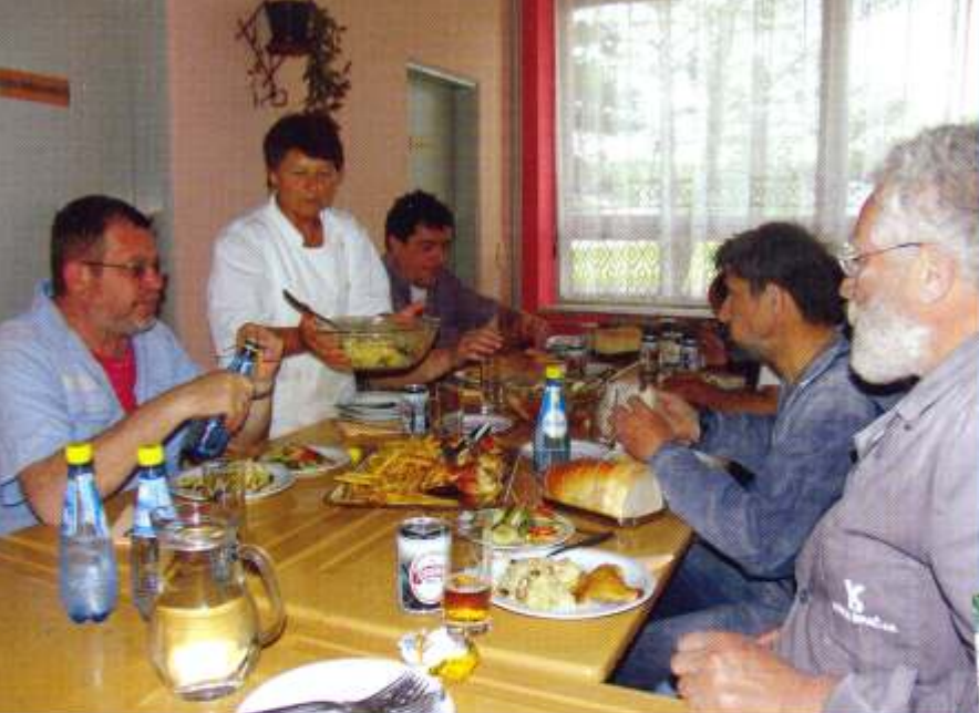
Školska kuhinja pružila je umjetnicima sjajnu logistiku