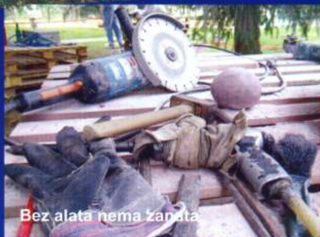
Bez alata nema zanata