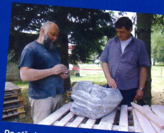
Do sřredu dáme tuto uhlazenou kouli... A-ha