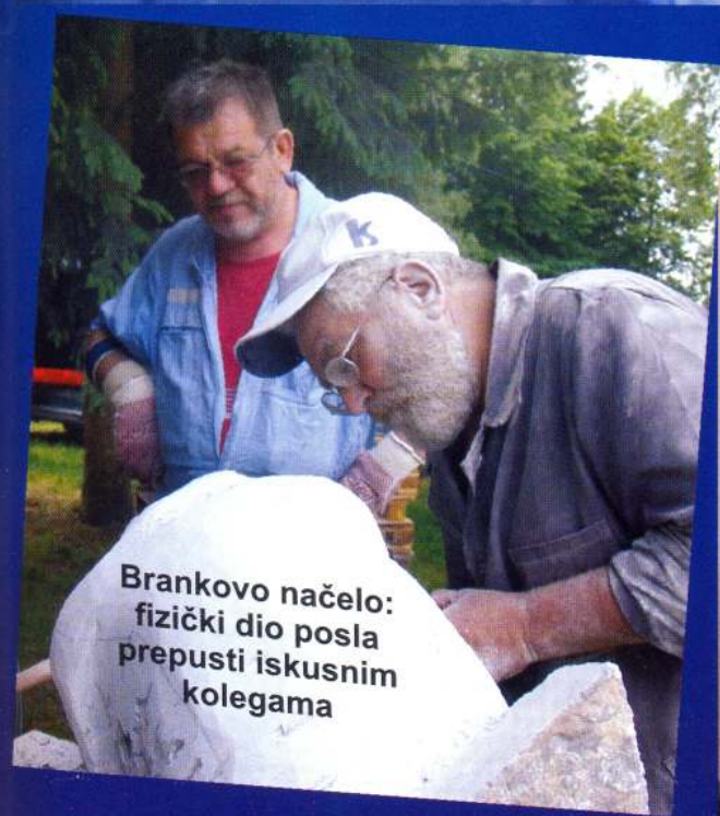
Brankovo načelo: fizički dio posla prepusti iskusnim kolegama