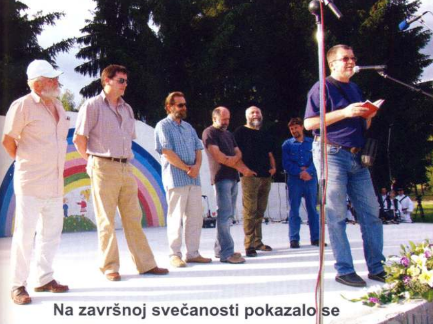
Na završnoj svečanosti pokazalo se